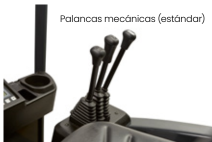
Palancas mecánicas (estándar)

El conductor puede elegir entre tres mandos hidráulicos diferentes, perfectamente posicionados para un manejo fácil y rápido de materiales. Las palancas mecánicas estándar montadas en la cubierta son fáciles de usar. Opcional: minipalancas separadas perfectamente integradas en el reposabrazos totalmente ajustable o dos palancas de mando de doble función.