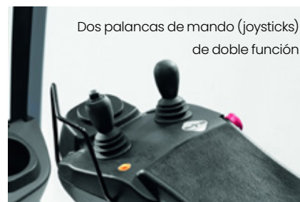
Dos palancas de mando (joysticks) de doble función