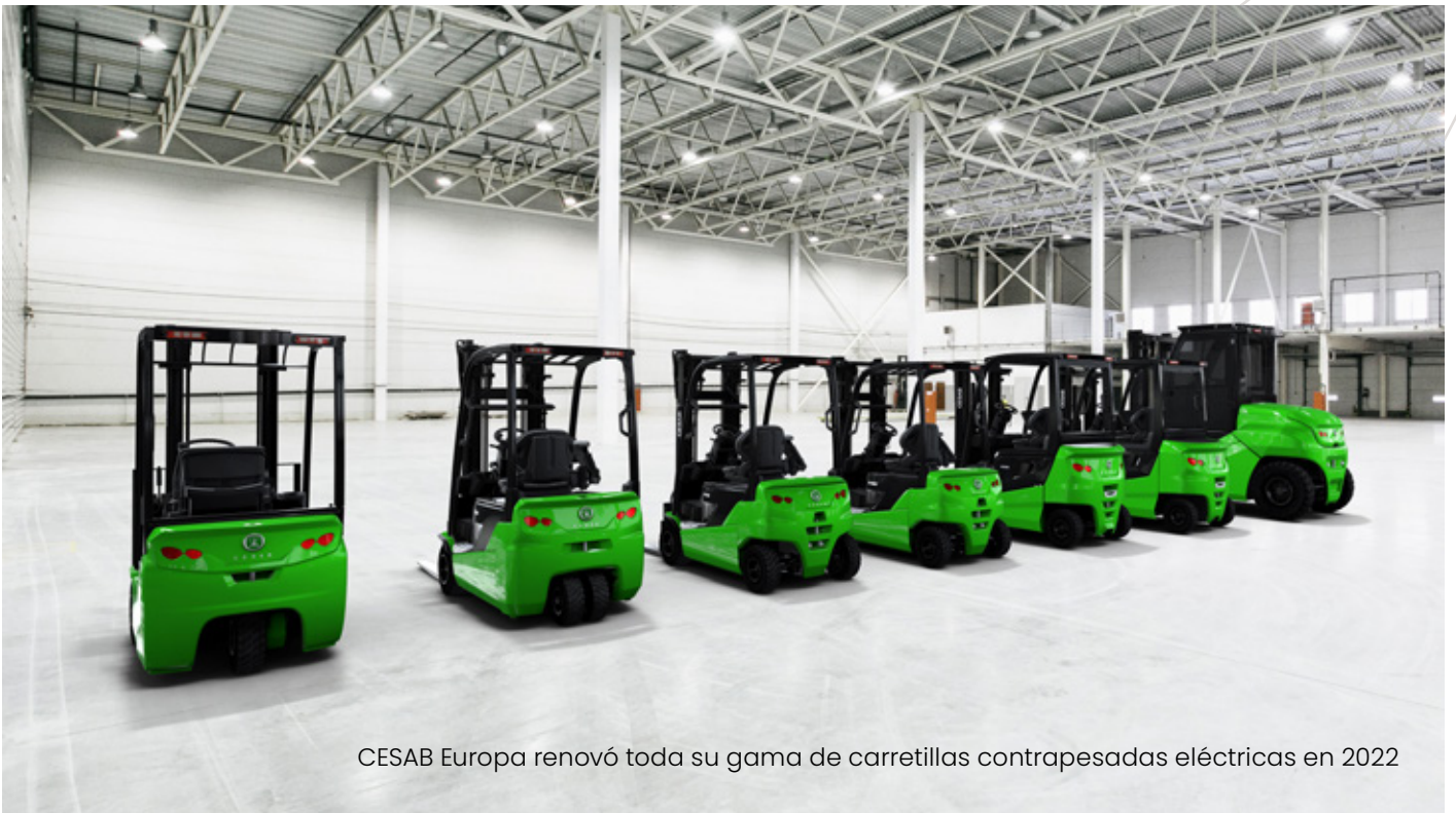
CESAB Europa renovó toda su gama de carretillas contrapesadas eléctricas en 2022