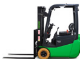
B213 1,25t @ LC 500